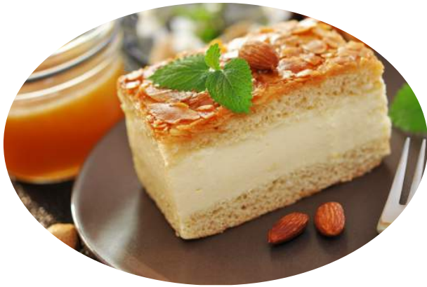
ビーネンシュティヒ Bienenstich

ドイツ語で「ハチの一刺し」を意味するドイツのお菓子。甘いイースト生地にはバニラカスタード・バター・クリーム・生クリームが挟んであり、上にはキャラメリゼされたアーモンドがトッピングされている。名前の由来は諸説あり、この菓子を発明した職人がケーキに誘われたハチに刺されたという言い伝えなどがある。